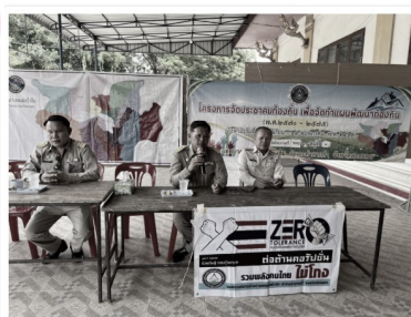
โครงการจัดประชุมหารือกัน เพื่อจัดทำแผนพัฒนาท้องถิ่น พ.ศ. 2571- 2575 27 เมษายน 2569