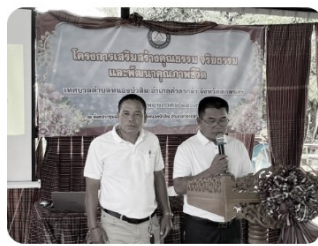
โครงการเสริมสร้างคุณธรรมจริยธรรม และพัฒนาคุณภาพชีวิต ประจำปี ๒๕๖๙(20 พฤษภาคม 2569)