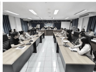
ประกาศนียบัตรไม่รับของขวัญหรือของกำนัลจากการปฏิบัติหน้าที่ (No Gift Policy) 11 พฤษภาคม 2569